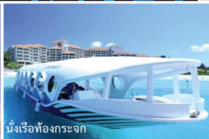
นั่งเรือท่องกระจาก