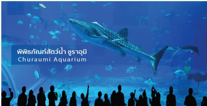
พิพิธภัณฑ์สัตว์น้ำ ชูราอุมิ Churaumi Aquarium