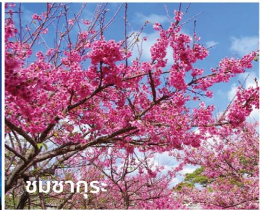
ชมซากุระ